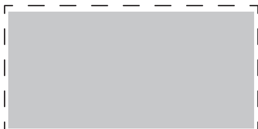
1:1 Vorlage auf Seite 2